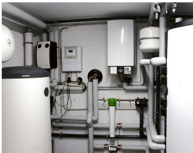
Zum Einsatz kommen hochwertige Luft-Wärmepumpen.

So ist die Dorstener Altstadt mit ihrem historischen Marktplatz fußläufig erreichbar und bietet zahlreiche Einkaufsmöglichkeiten. Zugleich sind die Lippe und der Kanal in der Nähe und bieten die Möglichkeit für einen Spaziergang oder eine Radtour. Weitere Informationen und Kontakt gibt es auch im Internet unter https://immobilien-krukenberg.de